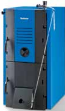
Logano G221 Na raspolaganju u četiri izvedbe prema snazi

Robustni Logano G221 pruža savršeno rješenje. Moguće ga je nesmetano uklopiti u postojeće sustave grijanja i jednostavno ga je instalirati. Prostrano oblikovani prostor punjenja i komora izgaranja čine punjenje jednostavnim i pogodnim. Lijevanoželjezni Logano G221 ne samo da izgleda snažno i pouzdano, nego, jednom kada je u radu, ostvaruje svoja obećanja - ugodnu toplinu, zimu za zimom.